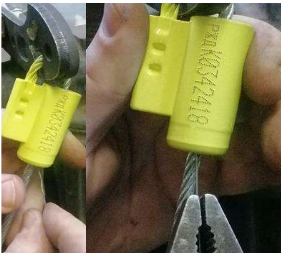
Рис. 3. Предварительные манипуляции с исследуемой пломбой

— предварительная подготовка испытателя (многократные манипуляции несанкционированного вскрытия и запираания ЗПУ, демонтаж конструкции исследуемого ЗПУ), по нашему мнению, не допускается (рис. 3).