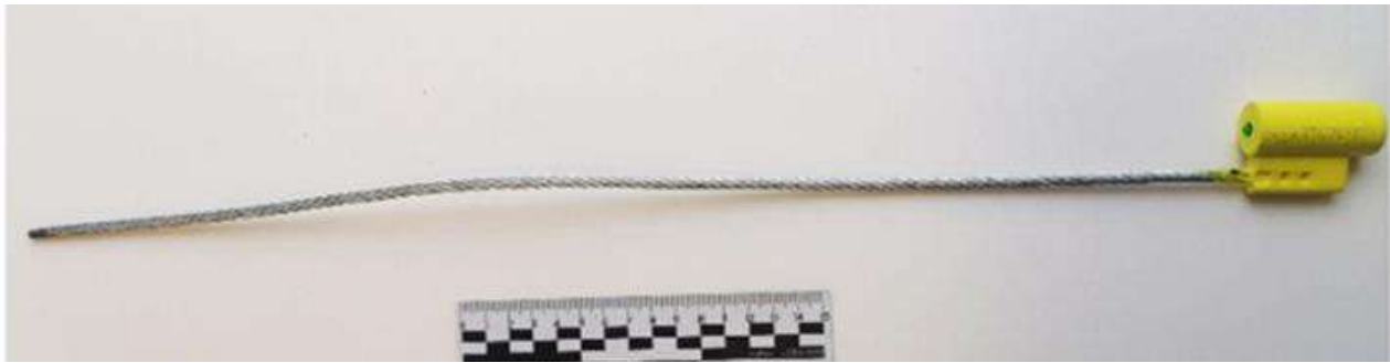
Рис. 1. Типовое тросовое запорно-пломбировочное устройство

В частности, в отношении ЗПУ «ОХРА-1» по результатам трех экспертиз даны следующие выводы.